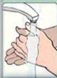
4. Rense - 10 sec