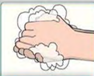
3. Lather ak fwote - 20 sec