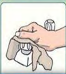
5. Vire nan Tap