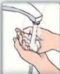
1. Mouye men ou