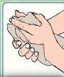
6. Seche men ou